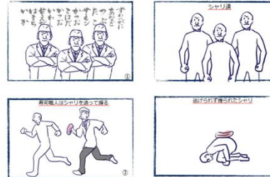
しいはしジャスタウェイ考案 「SUSHI AWAY」