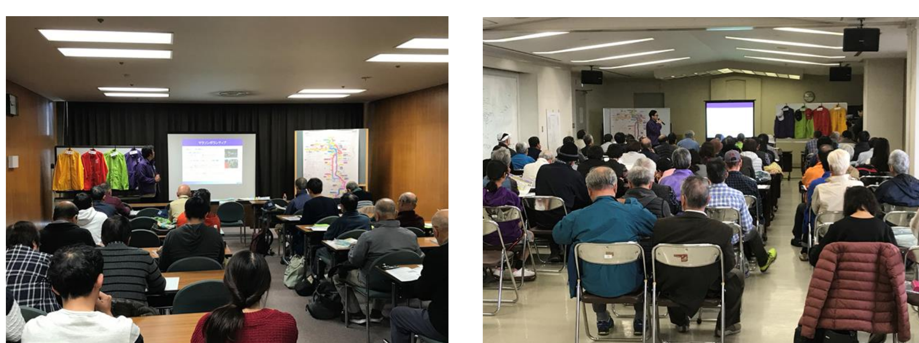
(ボランティア説明会の様子)

2018年11月17日、18日、24日の3日間に奈良市および天理市で開催された奈良マラソン2018ボランティア事前説明会の会場において、個人ボランティアとして参加した人を対象にアンケート調査を実施した。