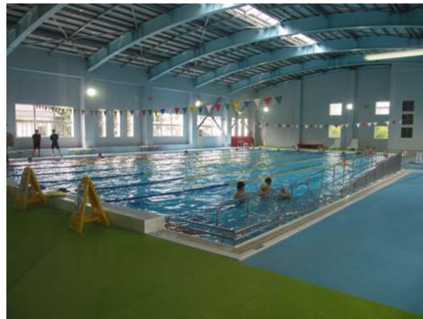
25m×7レーンのメインプール