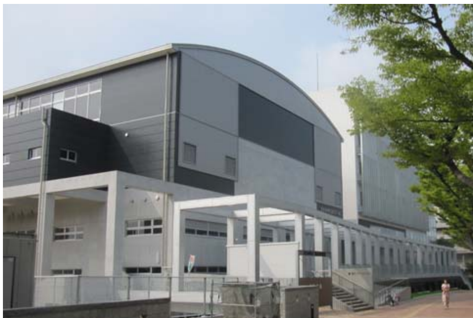
思永中学校外観（手前は体育館）

学校の改築と老朽化した市民プールの移転を合わせた学校プールの温水化 PFI事業による整備・運営