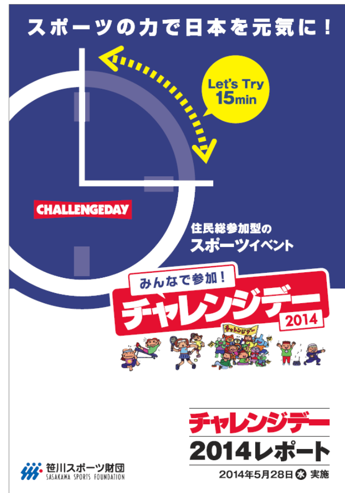
▲ 昨年版：『チャレンジデーレポート2014』