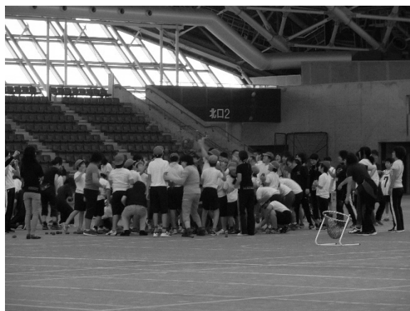
図表 3-14 連合運動会プログラム(2016年)

障害の程度や特性に応じてあらかじめ出場種目は決めておくと、当日の朝、体調変化等を考慮して、本人、教員、事務局が相談して最終決定する。また、集中力の持続が難しい児童生徒に配慮して、午前中に全プログラムが終了するように構成している。徒競走では順位を付けず、児童生徒がスタートからゴール、ゴール後の整列まで、教員のサポートにより実行している。また、会場の準備については、四日市ドームをAからJの10ブロックに分け、用具の準備等の役割を各学校に割り振るなど、大会運営を工夫している(図表 3-14)。