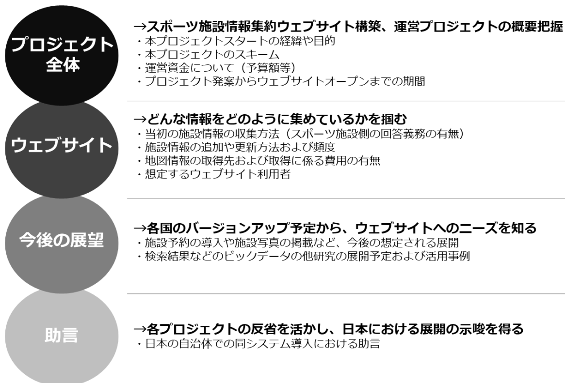
図2 インタビュー調査項目