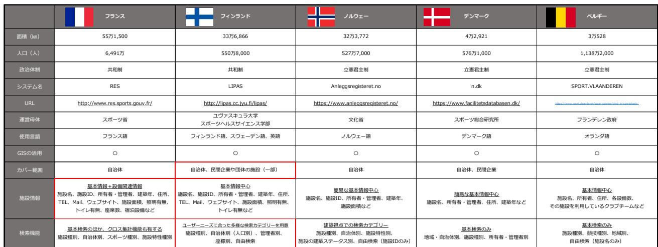
表4 ヨーロッパの主なスポーツ施設情報集約サイト

国際連合「Demographic Yearbook-2017」（2017）、外務省ウェブサイト（2019）、各スポーツ施設情報ウェブサイト（2019）などより作成