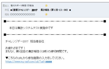
▲ 案内メール(イメージ)