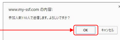
▲ メッセージ部分拡大図

※17時・22時の報告の際は、ともに前回報告時に入力したものを下回る数字は入力できません。 必ず前回以上の数字(=合計人数)を入力ください。