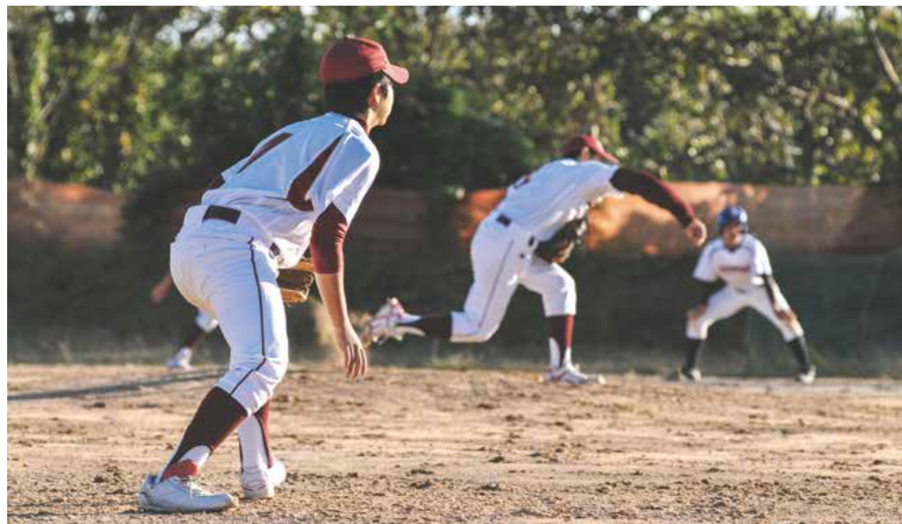
図表1 子どものスポーツ参加機会の充実に向けた情報