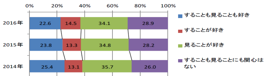
図 1 「スポーツに関心を持っている人の割合」

(出典) 【速報】2016年スポーツマーケティング基礎調査(株式会社マクロミル, 2016)